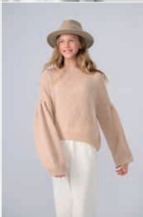
24 Pullover SOFFIO & SETASURI