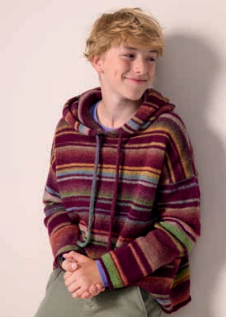
13 PULLOVER GOMITOLO MAGICO