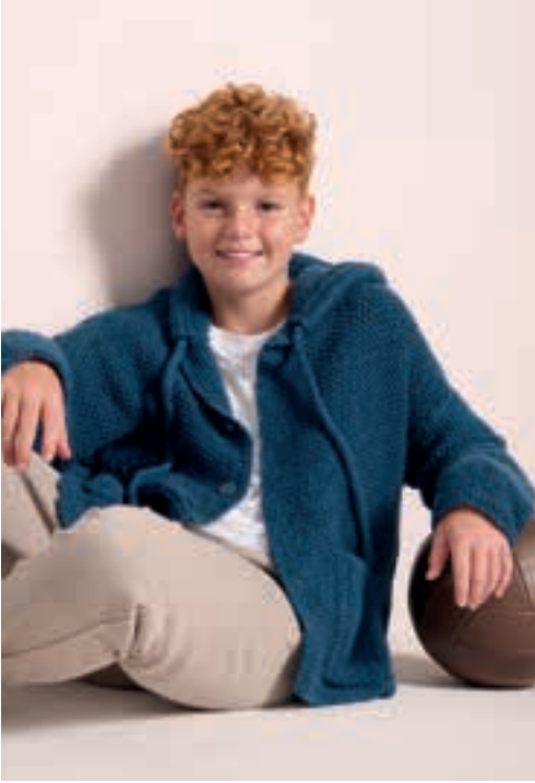
1 6 J A C K E COOL MERINO BIG