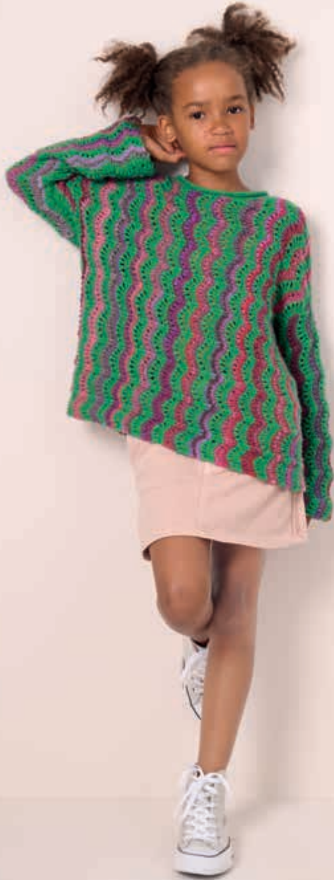
14 PULLOVER COLORISSIMO & ECOPUNO