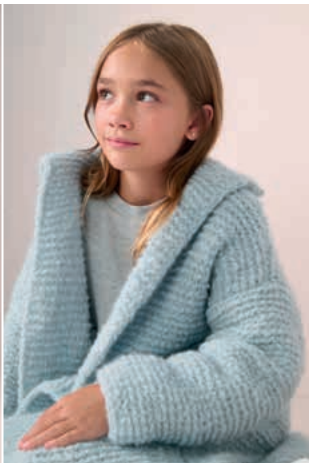
30 Mantel ROYAL ALPACA