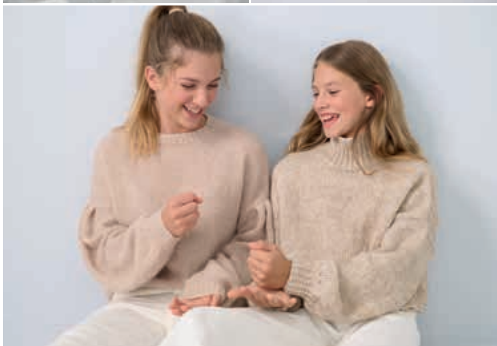
27 Pullover (rechte Seite)