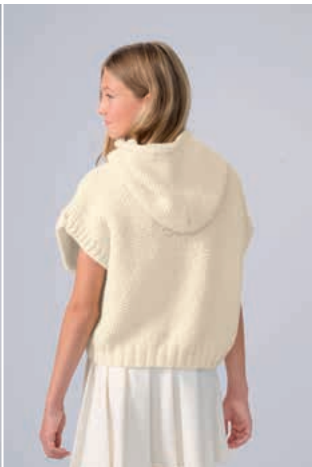
17 Pullunder COOL MERINO BIG