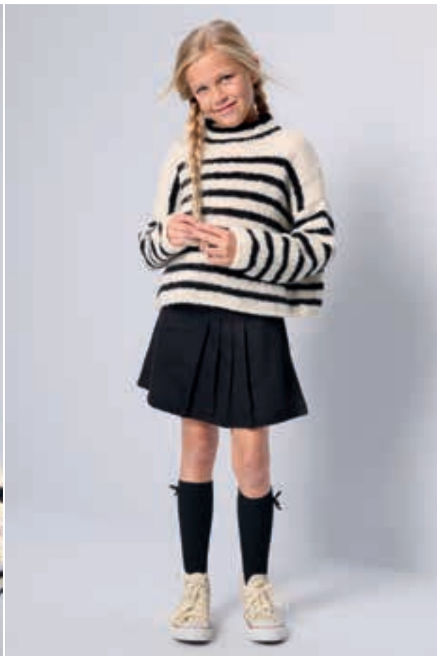
28 Pullover (linke Seite) / 29 Pullover (rechte Seite)