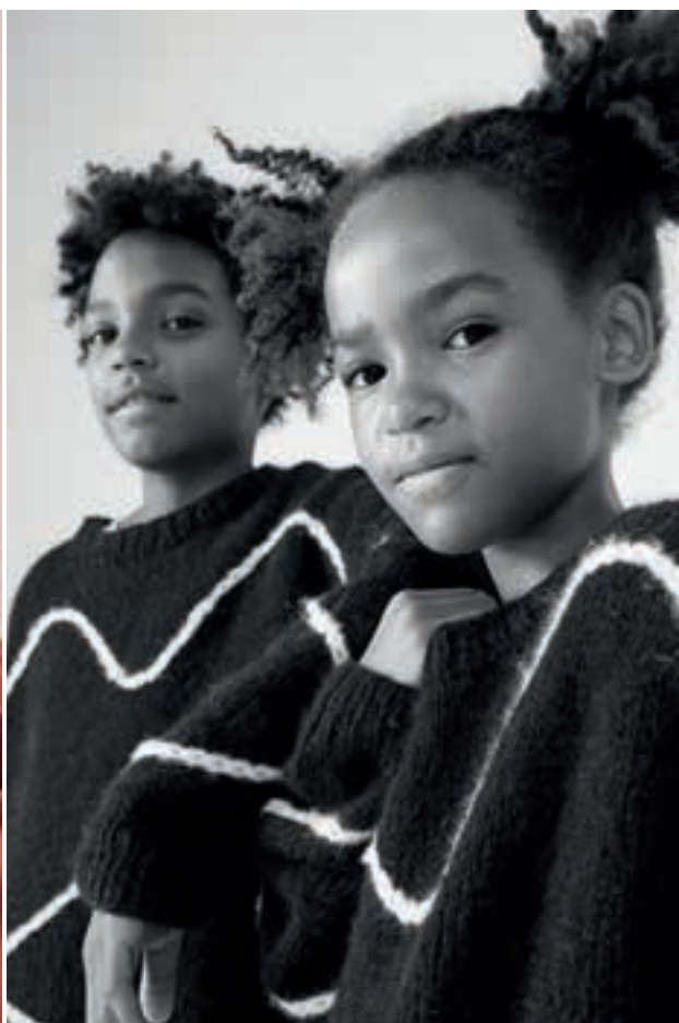
23 Pullover ALPACA AIR