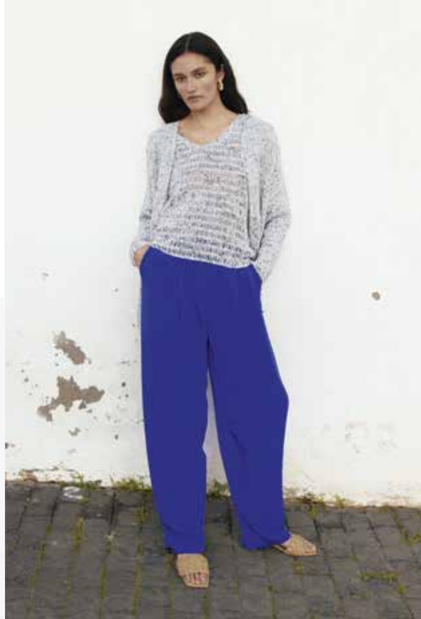
27/28 · Zeitloses Twin-Set aus luftigen Dreifachstäbchen. Garnneuheit MAGLIA unterstreicht das lebhaftes Muster.