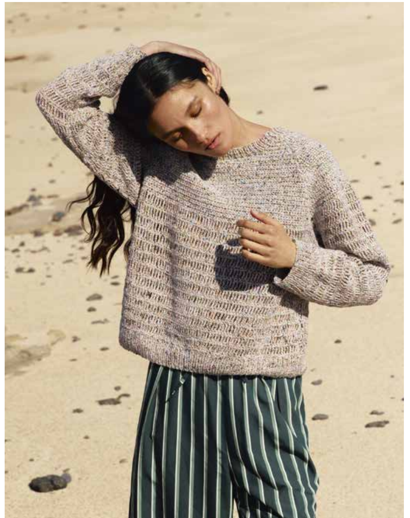
39 · Raglanpullover im Mustermix – gehäkelt aus Garnneuheit MAGLIA .