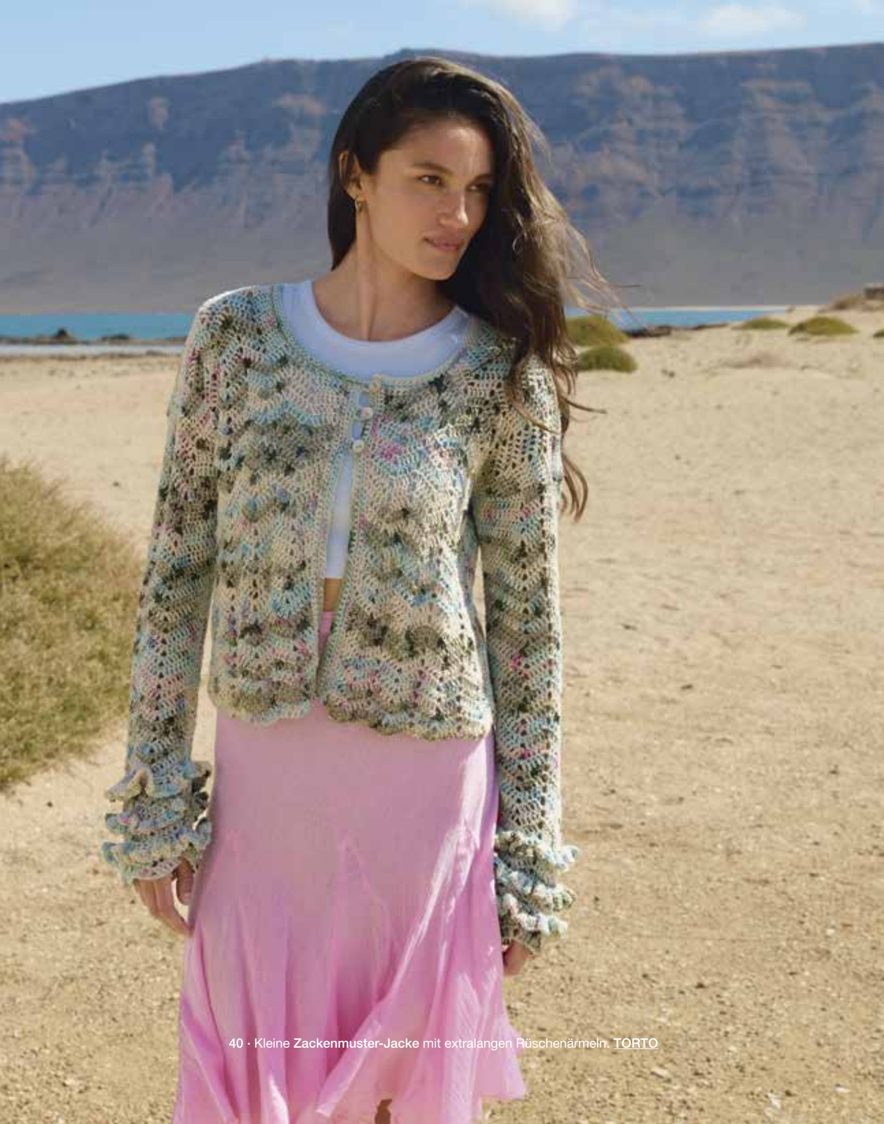
40 · Kleine Zackenmuster-Jacke mit extralangen Rüschenärmeln. TORTO