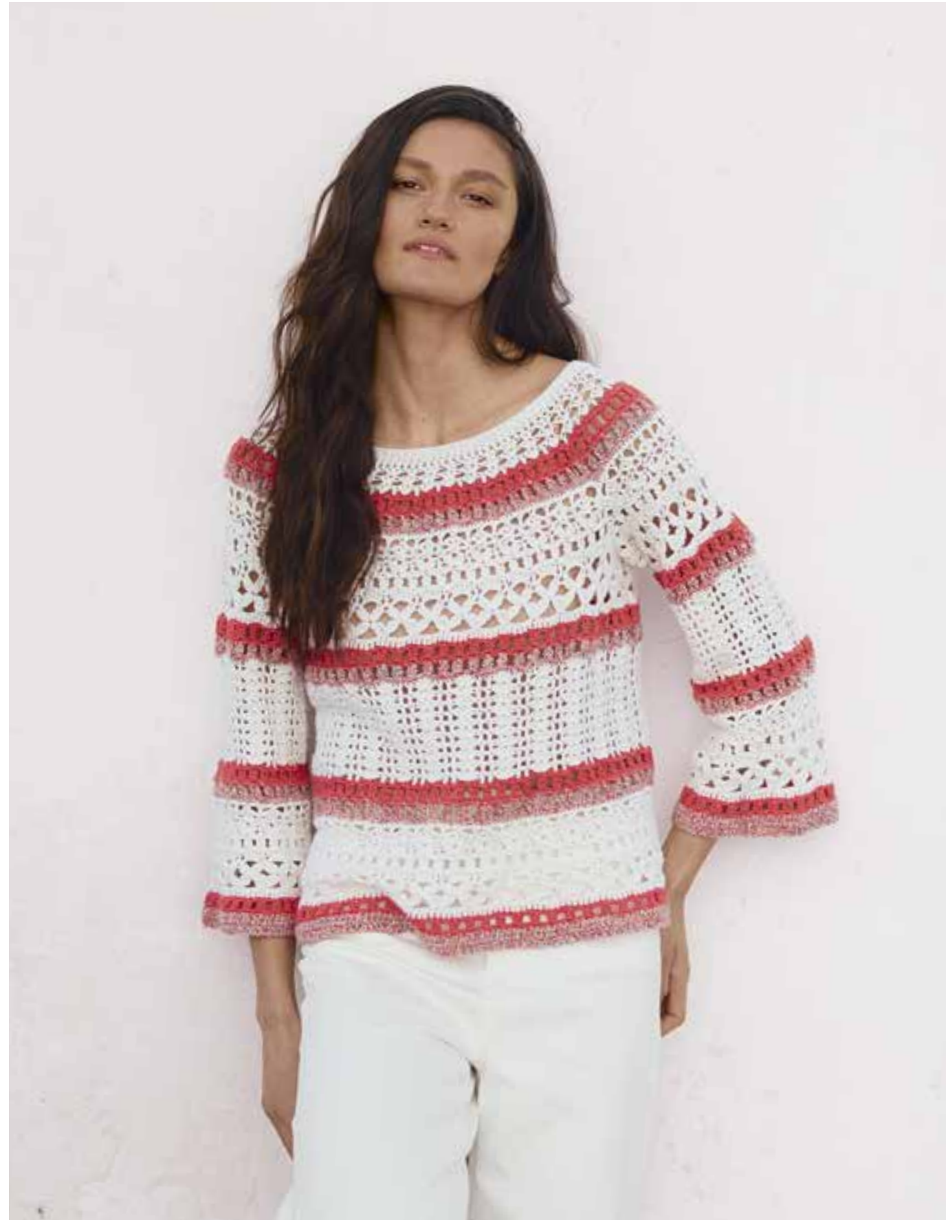
21 · Pullover im Mustermix und mit geraden Dreiviertelärmeln. SUMMER CASHMERE & MAGLIA