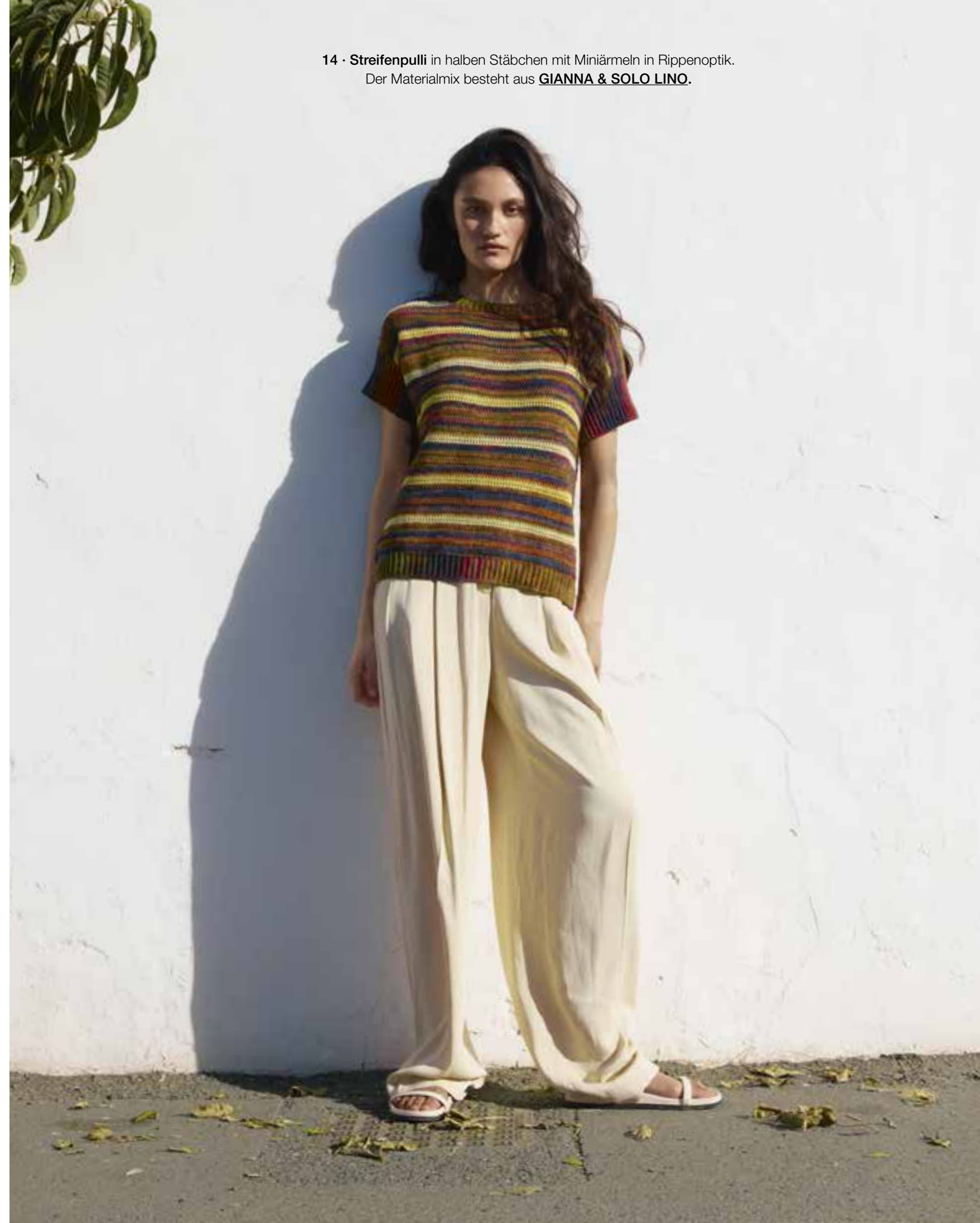
14 • Streifenpulli in halben Stäbchen mit Miniärmeln in Rippenoptik. Der Materialmix besteht aus GIANNA & SOLO LINO .