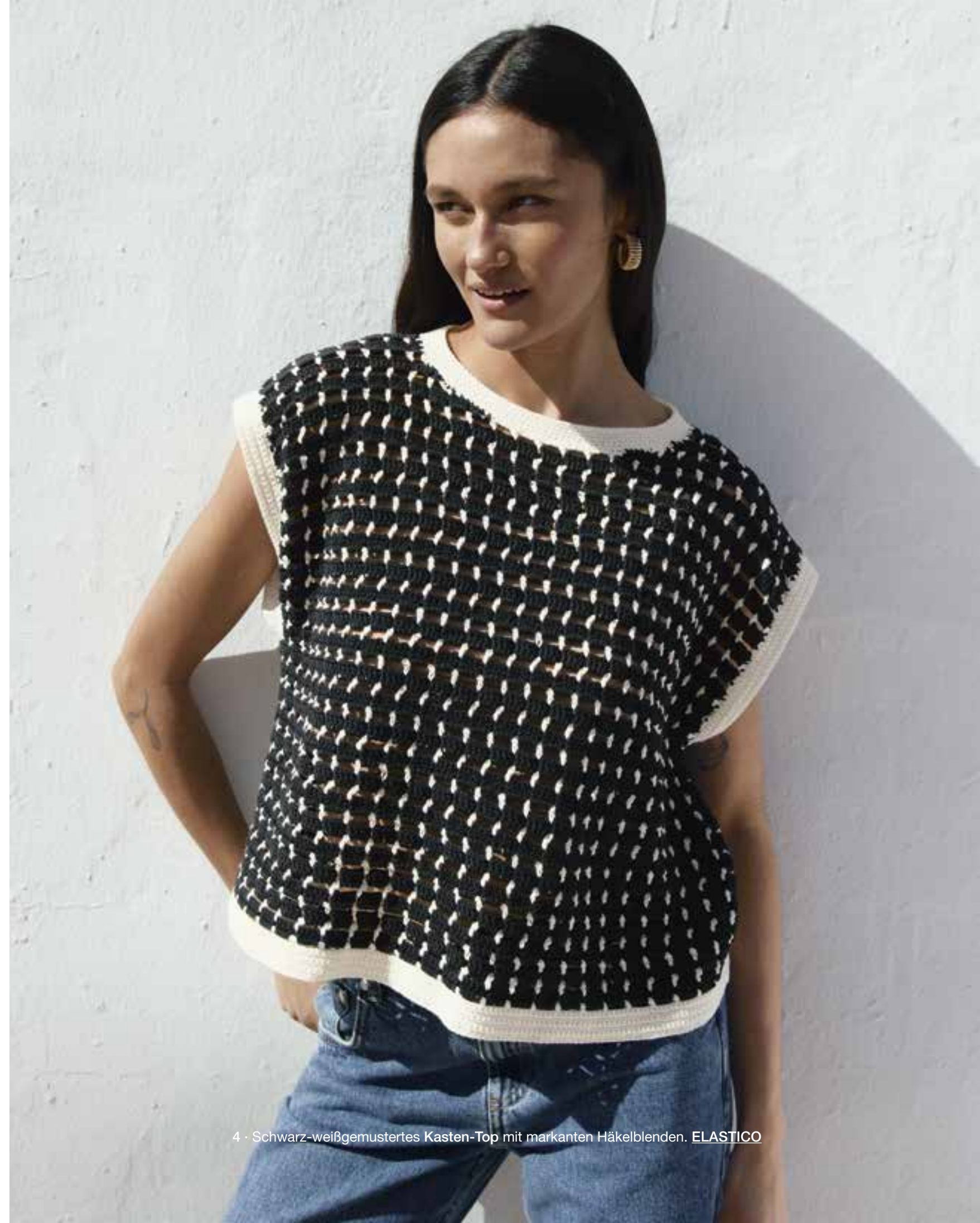
4 · Schwarz-weißgemustertes Kasten-Top mit markanten Häkelblenden. ELASTICO