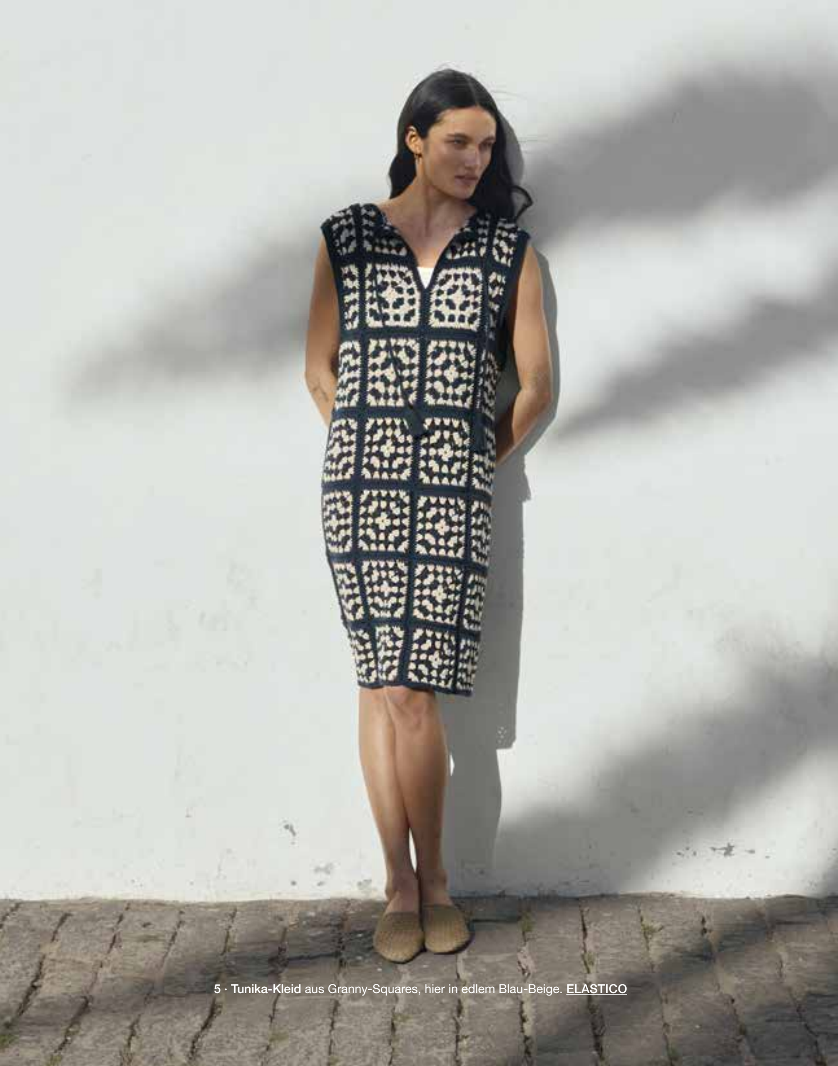
5 · Tunika-Kleid aus Granny-Squares, hier in edlem Blau-Beige. ELASTICO