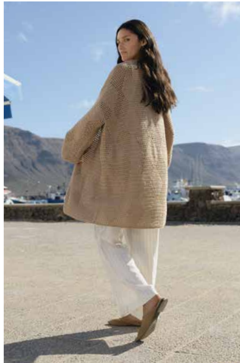
13 • Luxuriöser Oversize-Cardigan im Gitter-Rautenmuster – gehäkelt aus ALTA MODA COTOLANA .