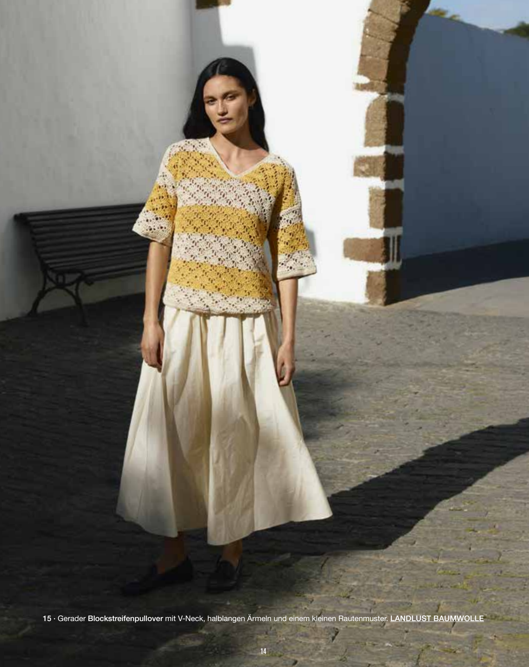
15 · Gerader Blockstreifenpullover mit V-Neck, halblangen Ärmeln und einem kleinen Rautenmuster. LANDLUST BAUMWOLLE