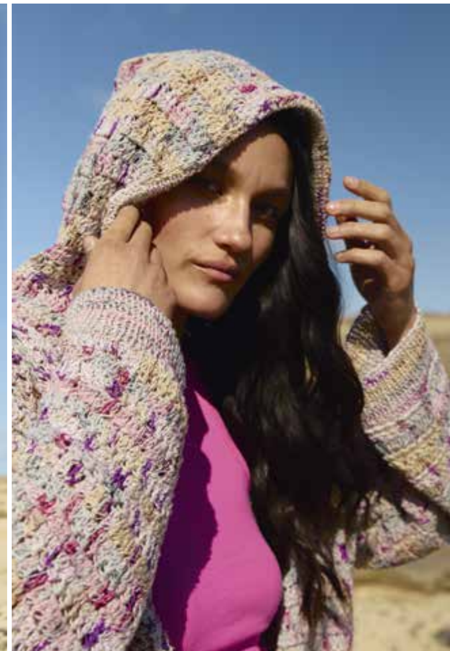
46 · Lässig-leichter Stäbchen-Hoodie – mal längs, mal quer gearbeitet. TORTO