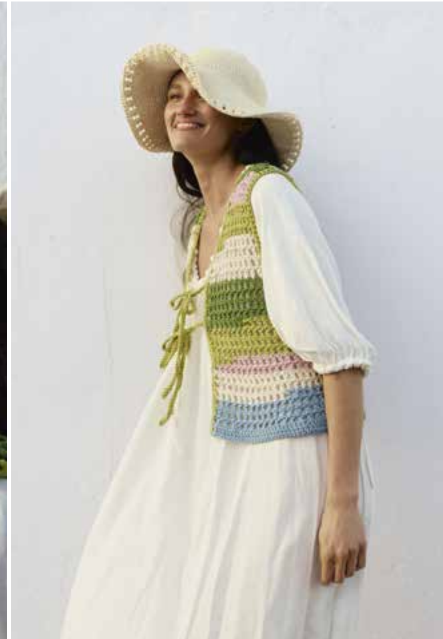
10/11/12 · Unregelmäßig gestreifte Weste , dazu eine Tasche aus festen Maschen und ein Schlapphut mit drahtverstärkter Krempe. Alles aus NATURAL COTTON .