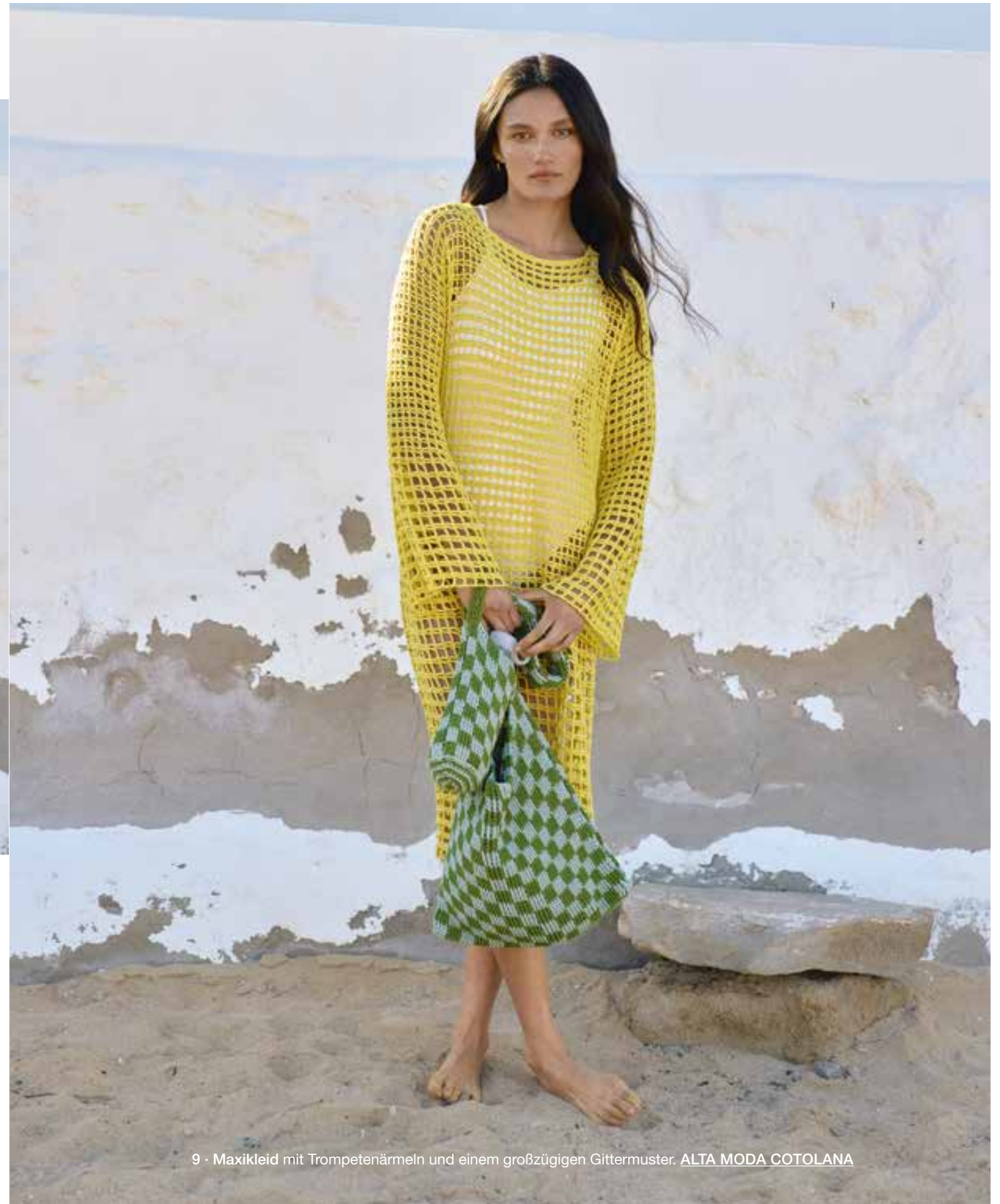
9 · Maxikleid mit Trompetenärmeln und einem großzügigen Gittermuster. ALTA MODA COTOLANA