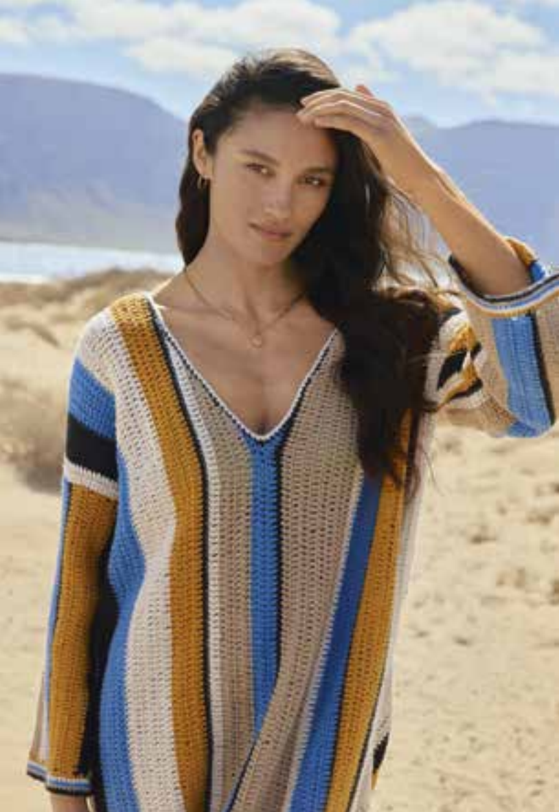
38 · Quergehäkelte Streifentunika in Gewürztönen und belebendem Blau. ALTA MODA COTOLANA