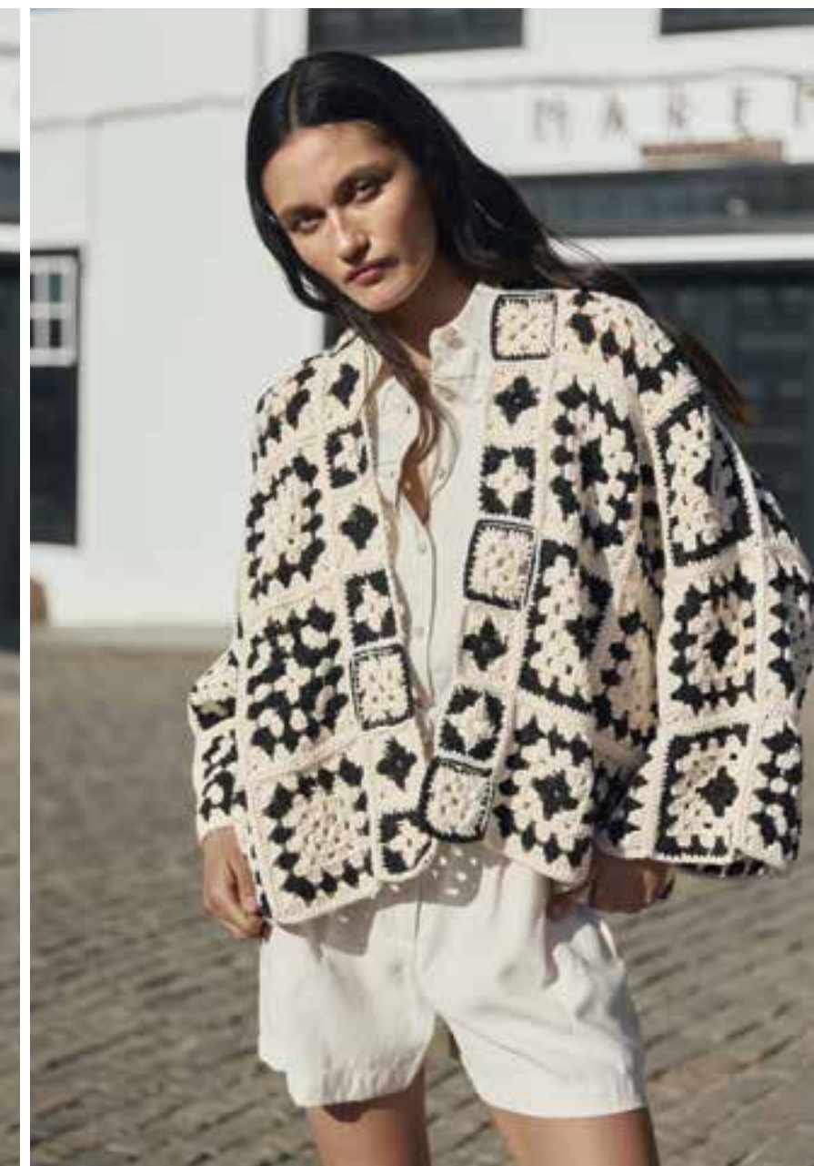
6 · Oversize-Jacke aus großen und kleinen Granny Squares in den Farben Schwarz und Offwhite. CAMPO