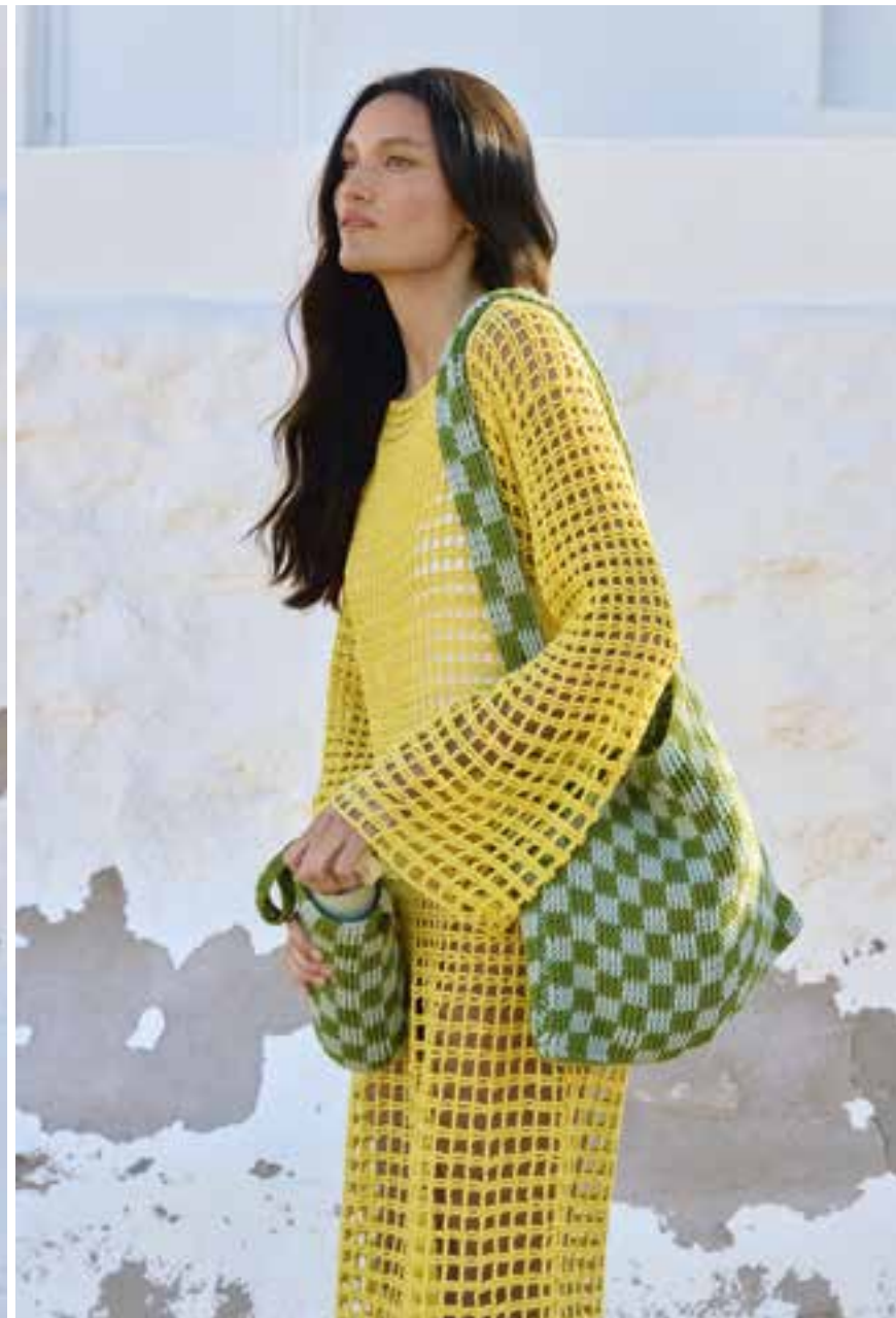
7/8 · Shopper und Flaschentasche im Schachbrettmuster. Gehäkelt wird in Reliefstäbchen. PROMESSA