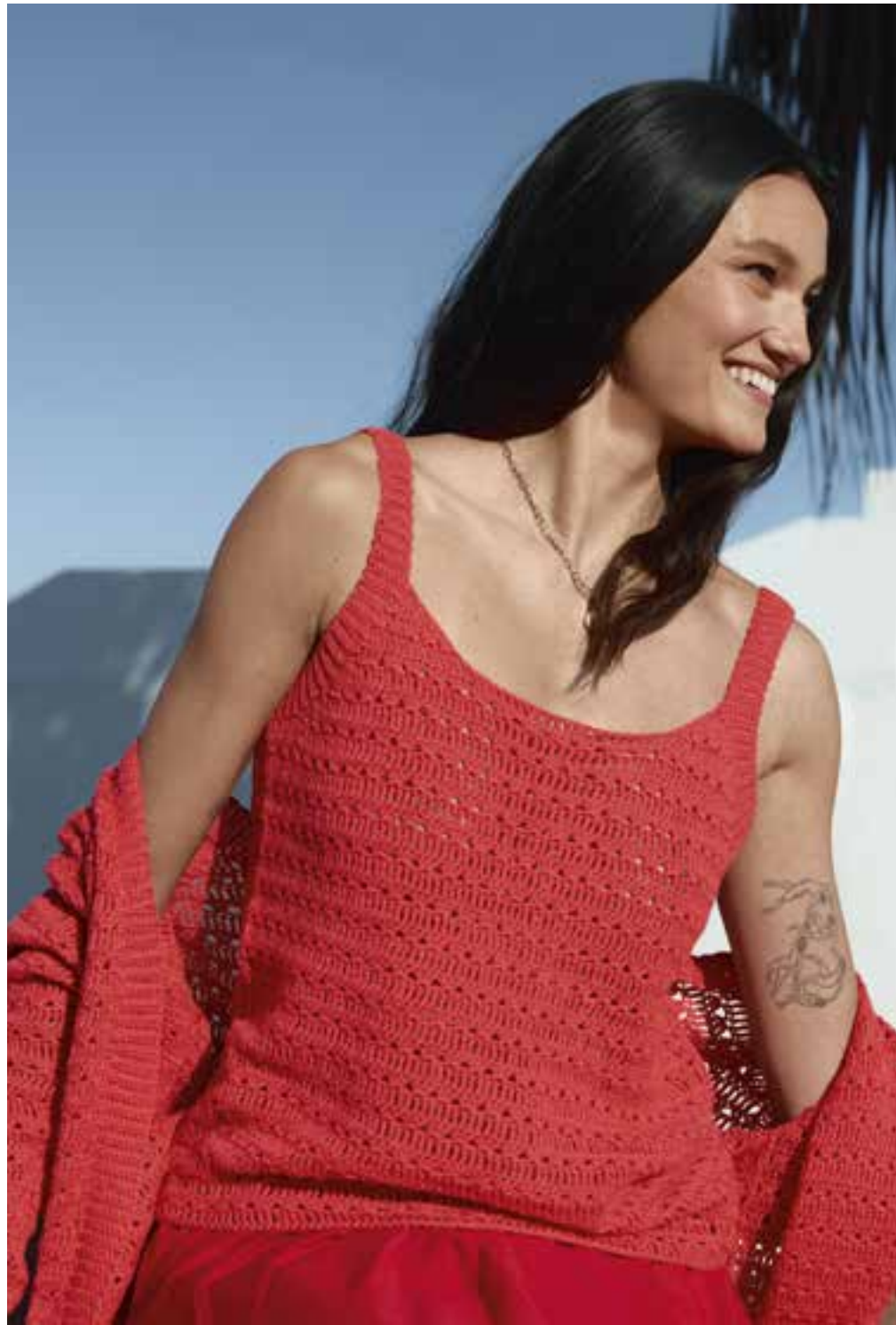
23/24 · Twin-Set aus Stäbchen- und Lochmusterreihen, gehäkelt aus unserer Garnneuheit SUMMER CASHMERE .