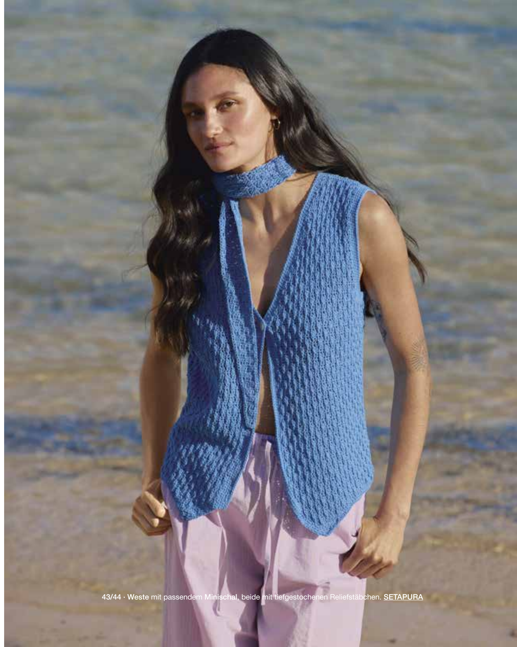
43/44 · Weste mit passendem Minischal, beide mit tiefgestochenen Reliefstäbchen. SETAPURA