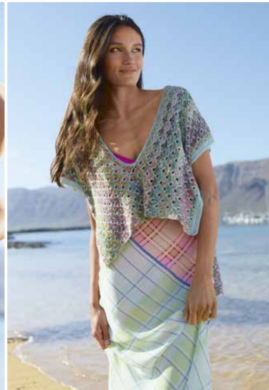
41 · Asymmetrische Cropped-Tunika im Material- und Mustermix. CAMPO & MOSAICO