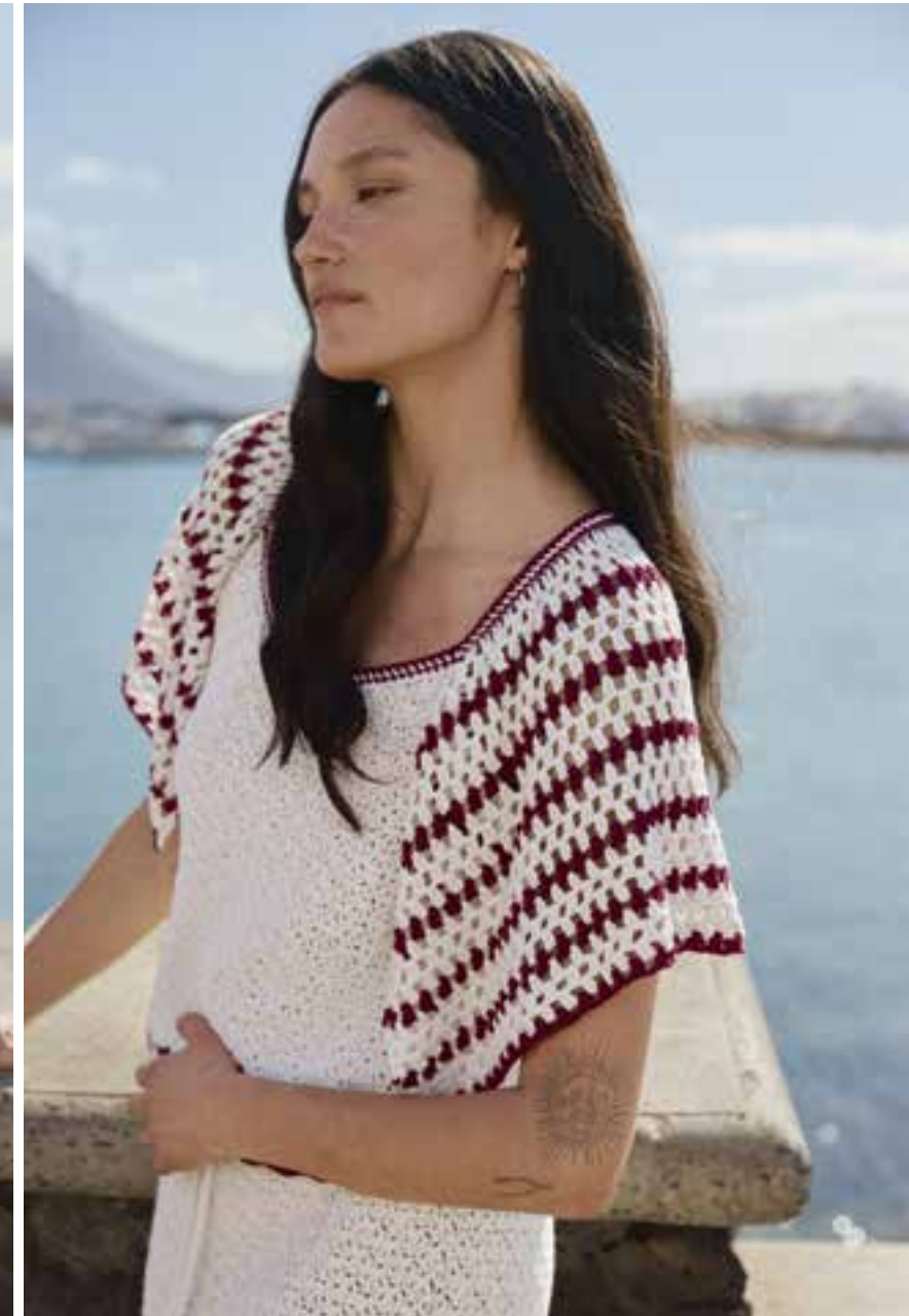
25/26 · Zum Top mit spektakulären Ärmelvolants ein schmaler Rock mit eingezogenem Taillenband. Beides aus CAMPO .