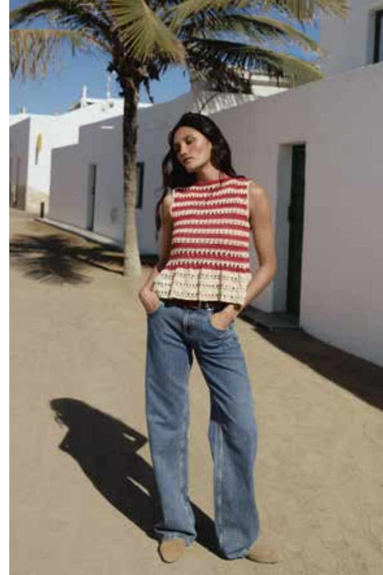
22 · Mustermix-Top mit geradem Halsausschnitt und einem verspielten Saumvolant. SETAPURA