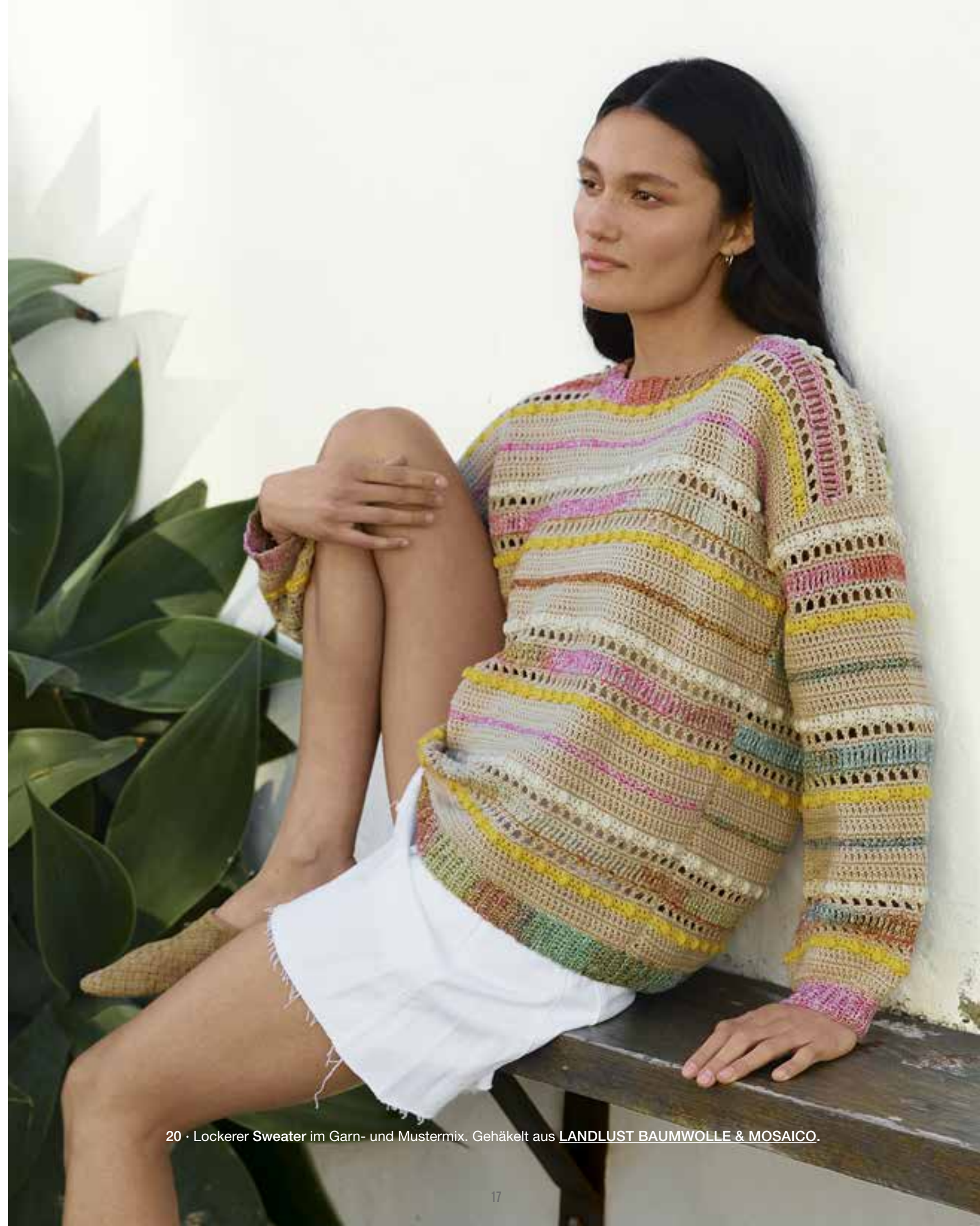
20 · Lockerer Sweater im Garn- und Mustermix. Gehäkelt aus LANDLUST BAUMWOLLE & MOSAICO .