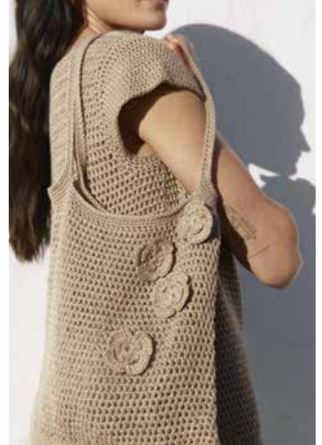
16/17 · Top und Tasche im Stäbchenmuster und mit applizierten Blüten. Beides aus ALTA MODA COTOLANA.