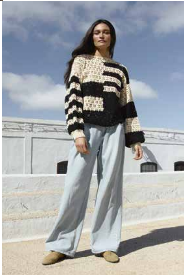
3 · Punktmuster-Pulli mit Ballonärmeln und Bändchenverschluss (Nacken) – gehäkelt aus SETAPURA .