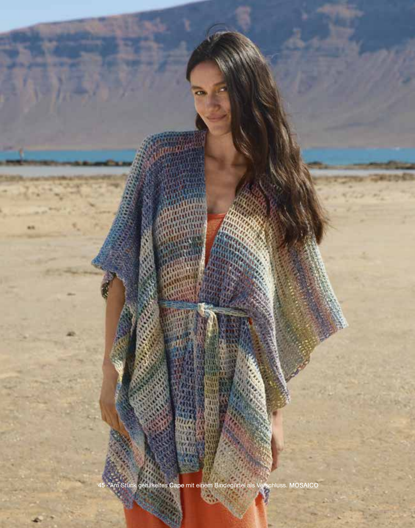
45 · Am Stück gehäkeltes Cape mit einem Bindegürtel als Verschluss. MOSAICO