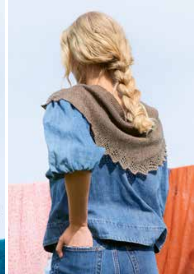
29 | Schal, li. Seite · COOL WOOL LACE & COSMO & SILKHAIR · Modell von @eva_winckler