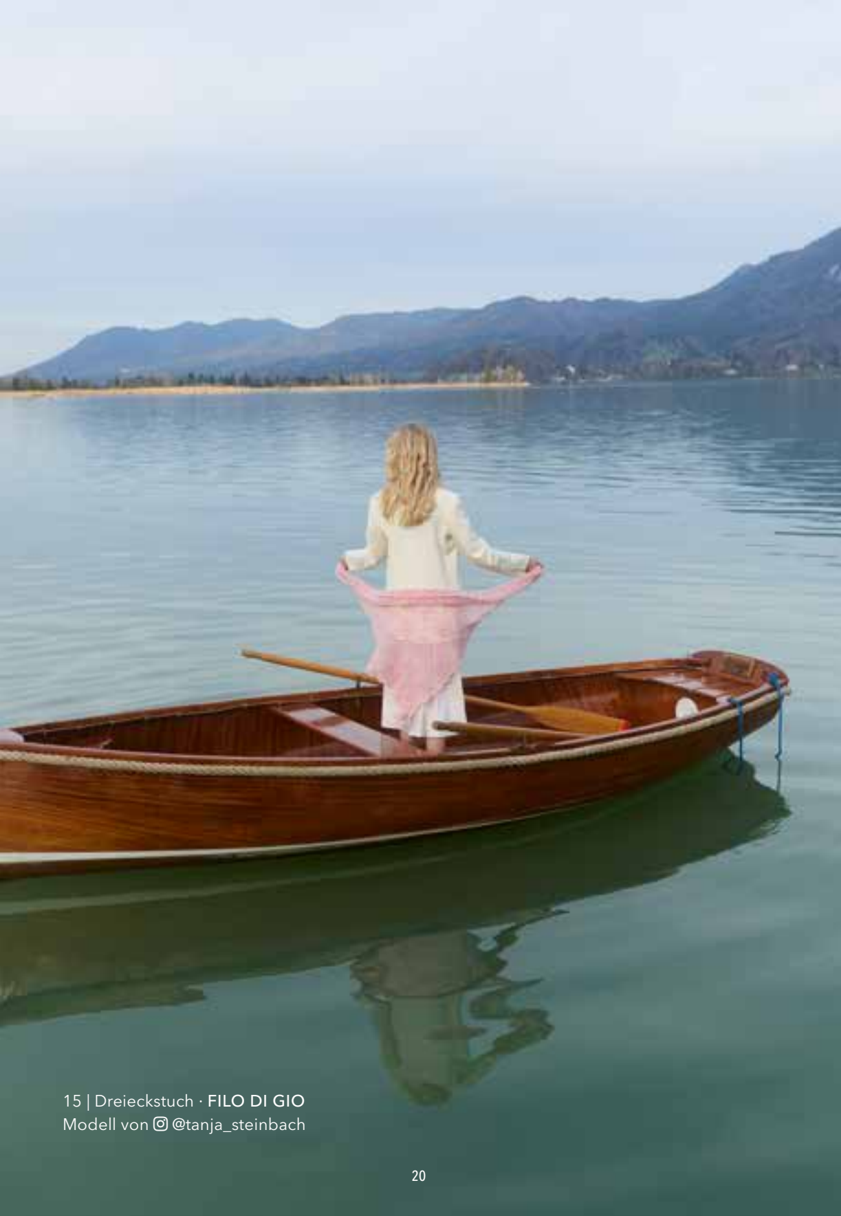
15 | Dreieckstuch · FILO DI GIO Modell von @tanja_steinbach