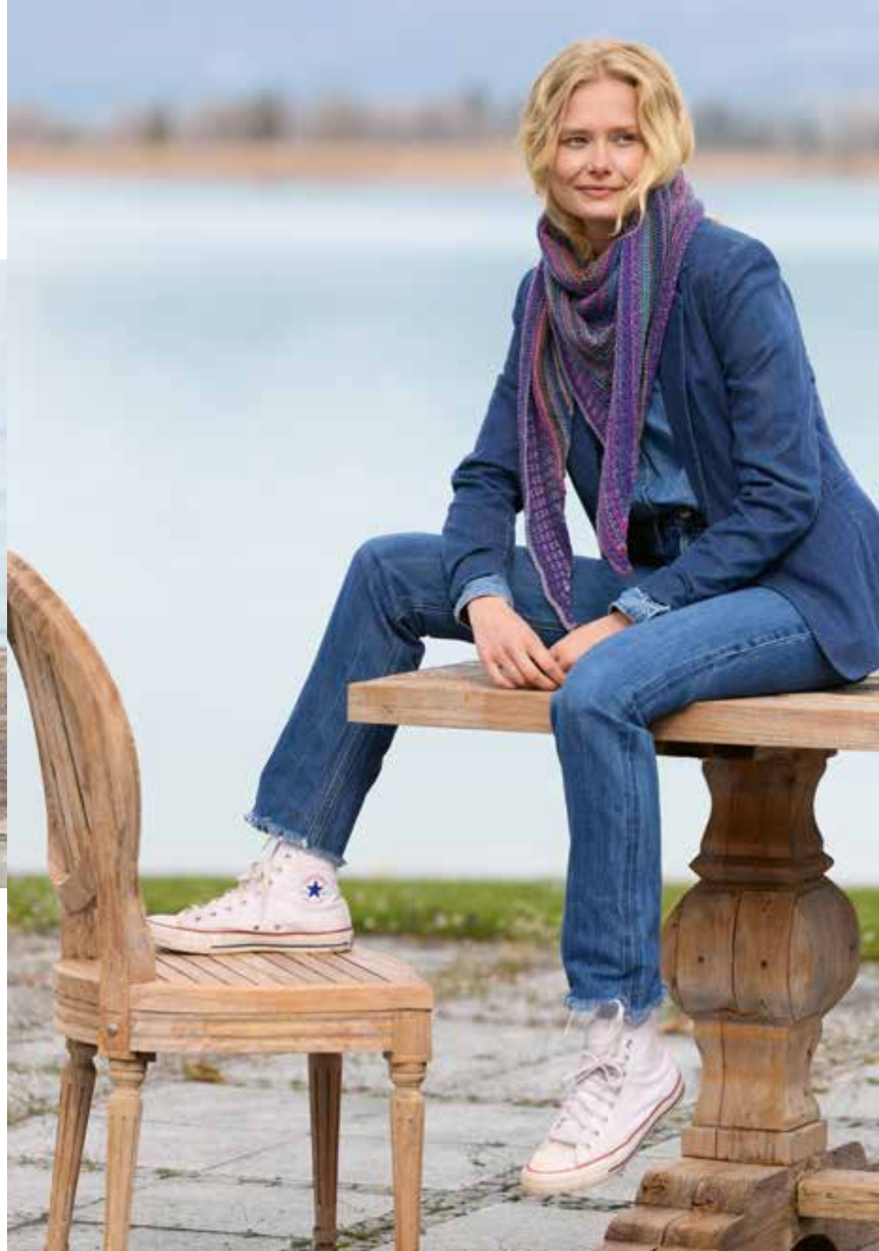
5 | Schal, li. Seite · FARFALLA & COOL MERINO Modell von @andrewknits