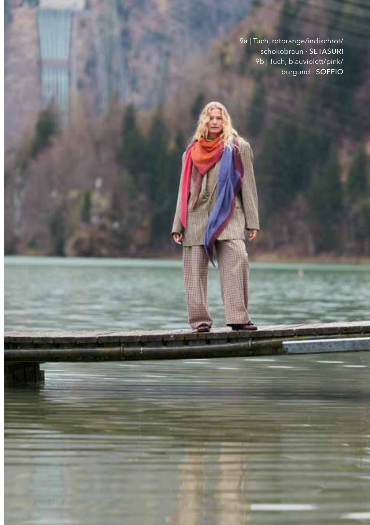
9a | Tuch, rotorange/indischrot/ schokobraun · SETASURI 9b | Tuch, blauviolett/pink/ burgund · SOFFIO