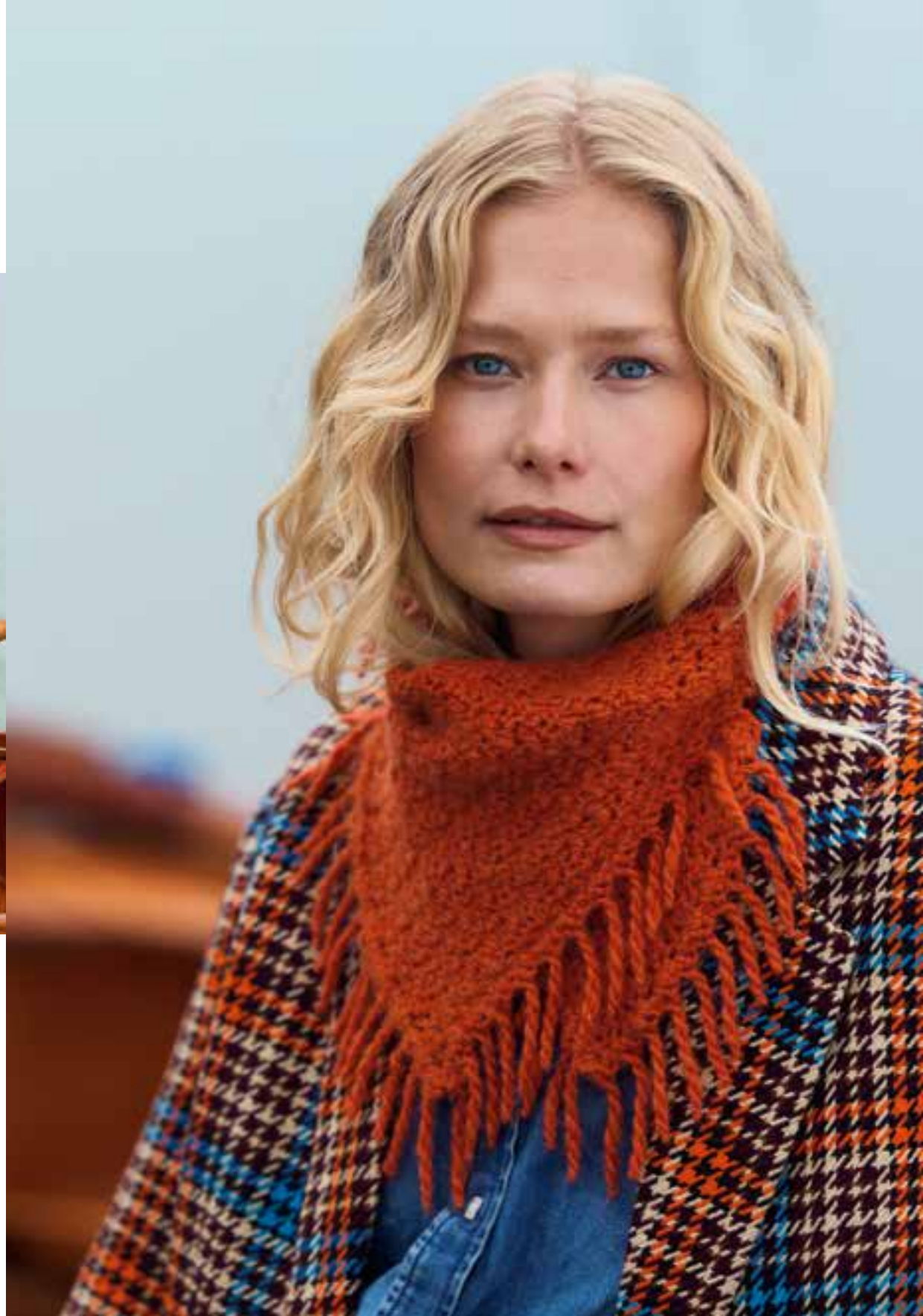
7 | Tuch, li. Seite · ECOPUNO SFUMATO Modell von @sabineruf_handstrick