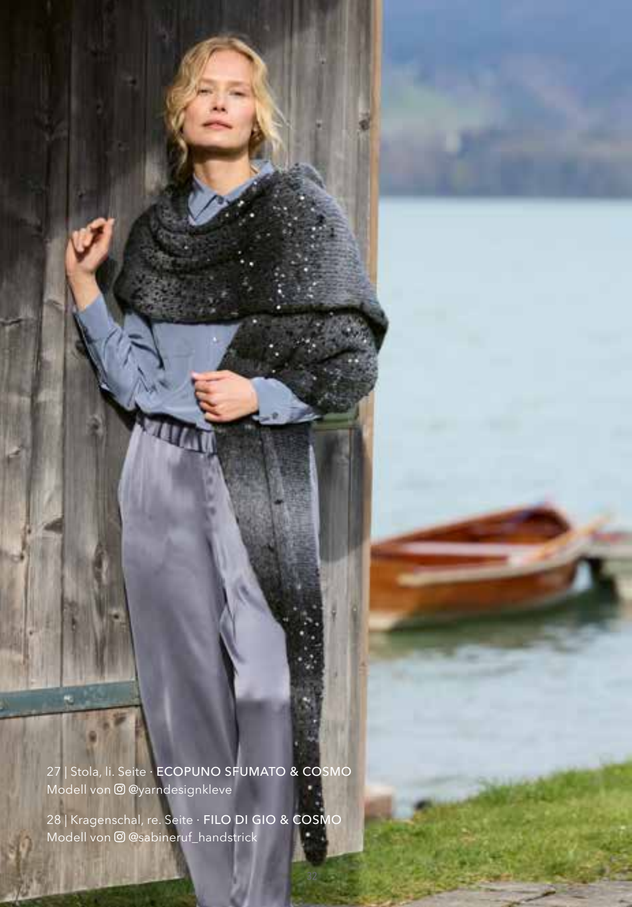
27 | Stola, li. Seite · ECOPUNO SFUMATO & COSMO Modell von @yarndesignkleve