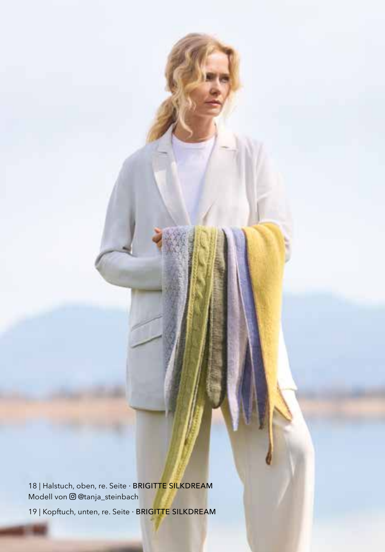
18 | Halstuch, oben, re. Seite · BRIGITTE SILKDREAM Modell von @tanja_steinbach