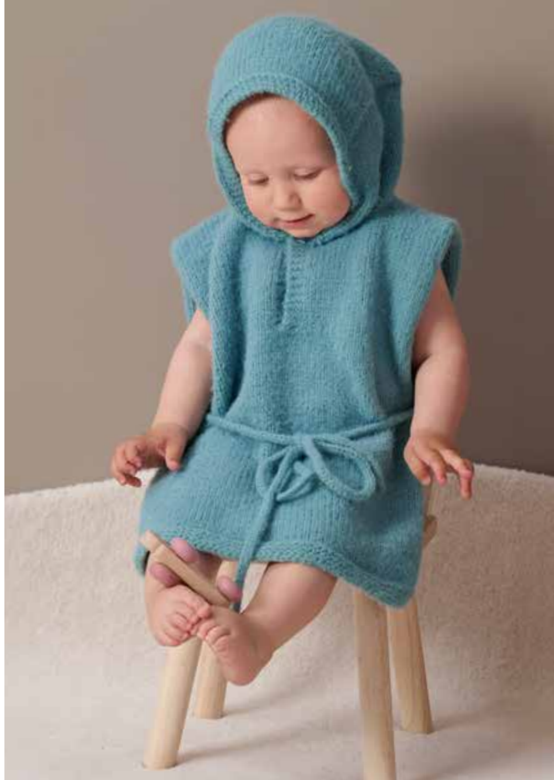
3 BADECAPE – COSY SOCKS 4 MÜTZE, 5 JACKE, 6 HOSE – COSY SOCKS