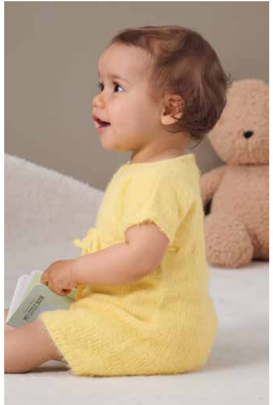
14 KLEID – COSY SOCKS