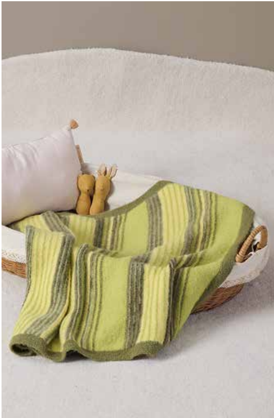
10 DECKE – COSY SOCKS