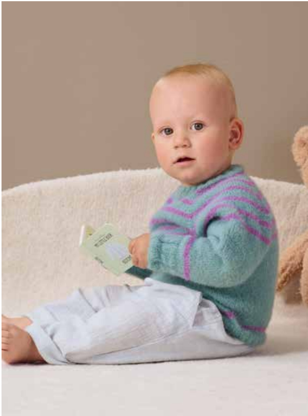
1 RAGLANPULLOVER – COSY SOCKS