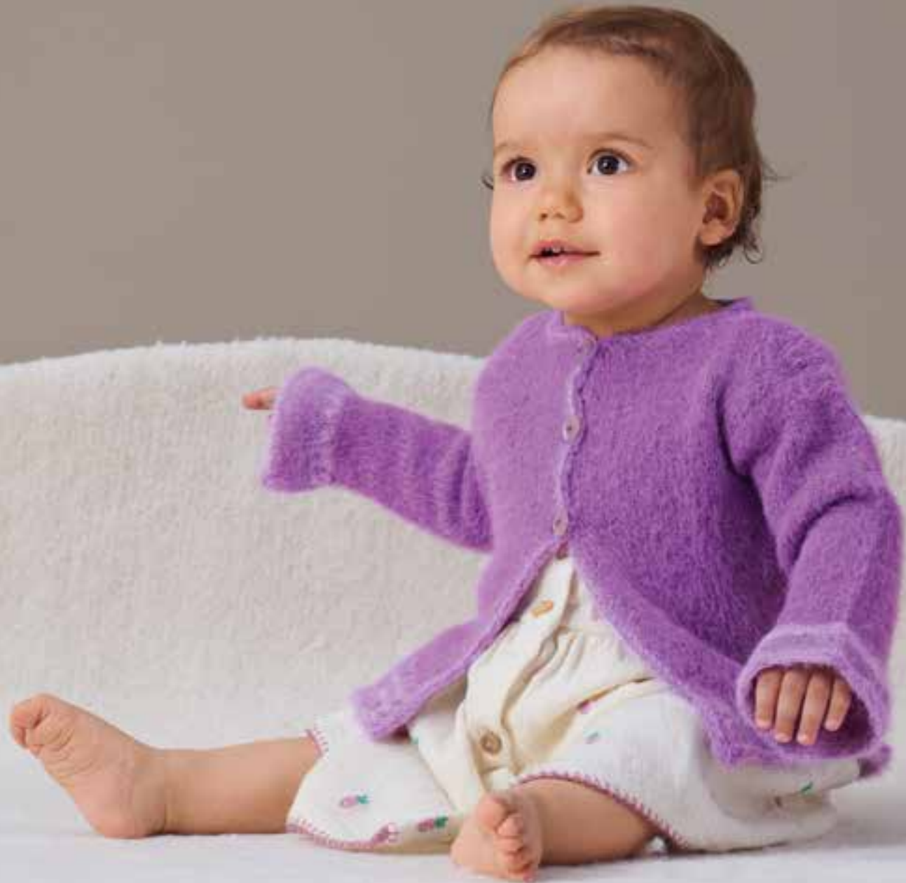
7 JACKE – COSY SOCKS