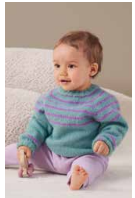
2 STREIFENPULLOVER – COSY SOCKS