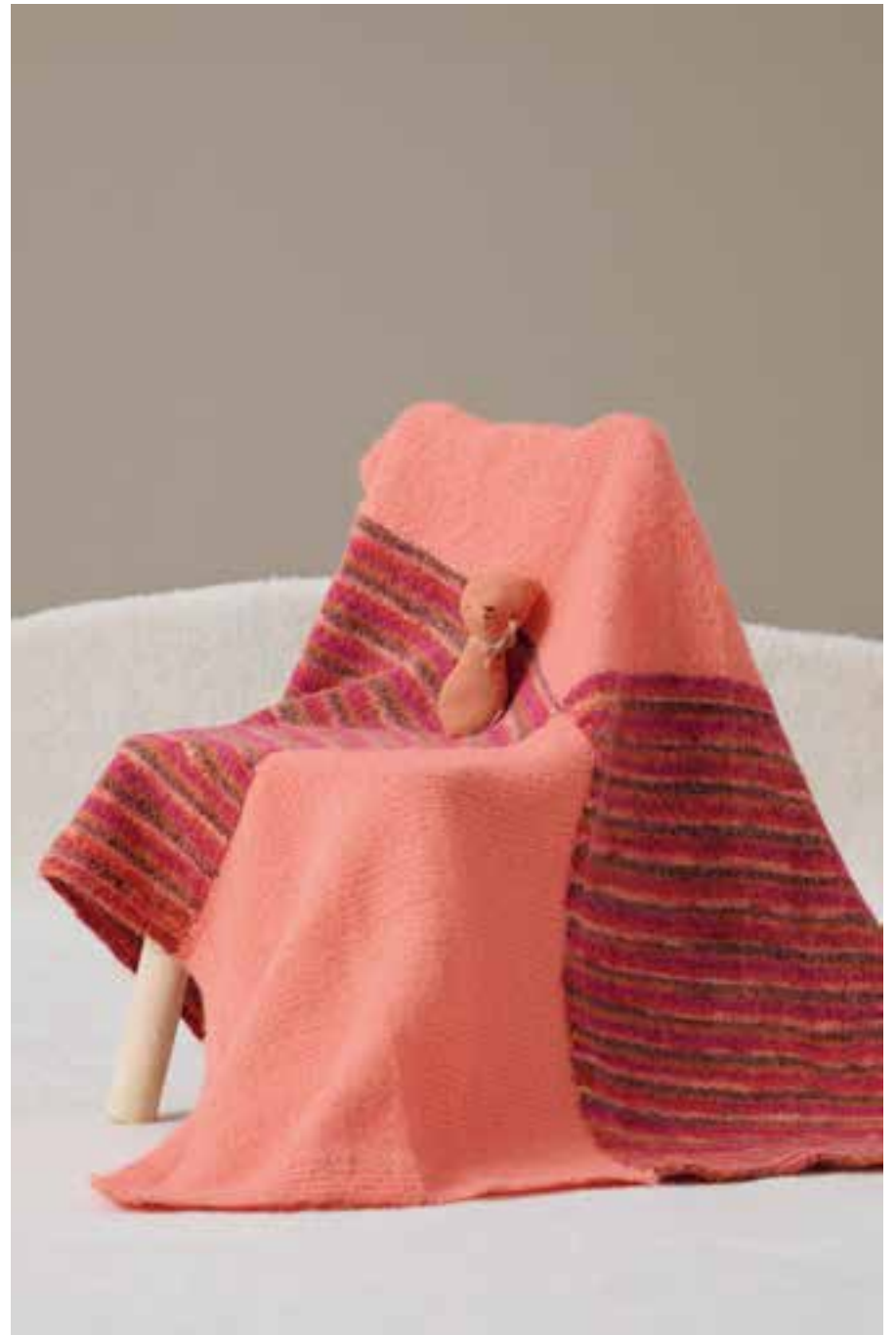
11 DECKE – COSY SOCKS