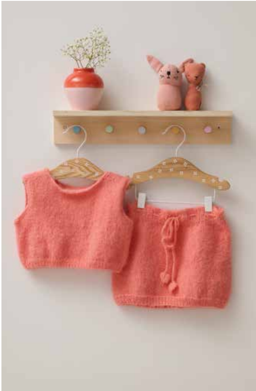
12 TOP – COSY SOCKS 13 ROCK – COSY SOCKS