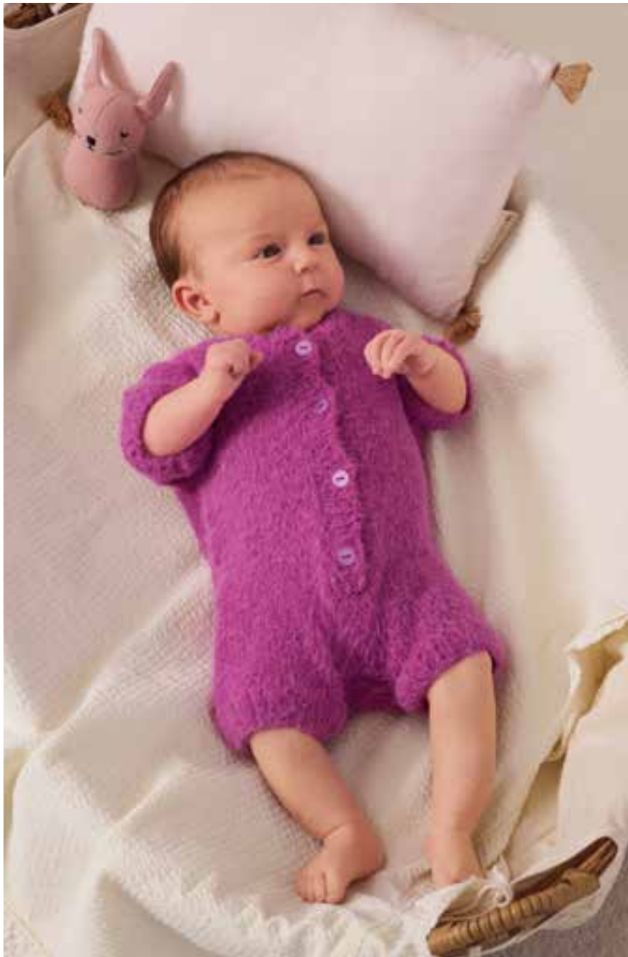
8 OVERALL – COSY SOCKS